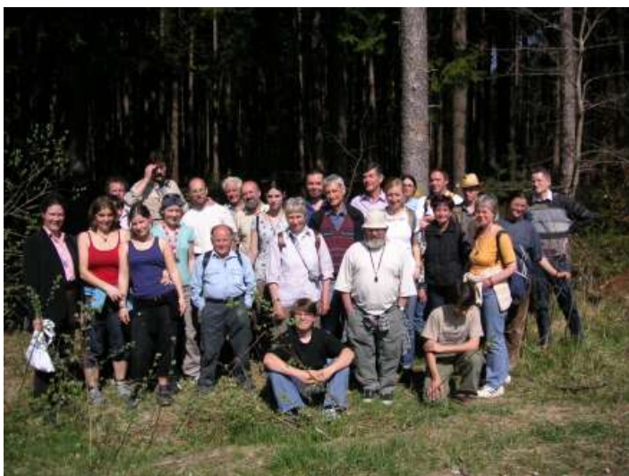
Im Jahr 2007 haben 46 Personen an den Ausbildungen teilgenommen. Bild: Teilnehmer am Lehrgang im Walderlebniszentrum Sauschütt in Grünwald bei München

Anschließend besteht die Möglichkeit zur Besichtigung des Informationszentrums für Ameisenkunde. Gäste sind herzlich willkommen.