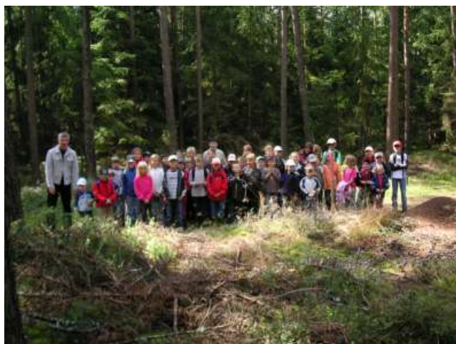
Besuch bei den Waldameisen, unter diesem Motto stehen Führungen für Kinder. Wenn Sie Interesse haben, wir kommen gerne auch zu Ihnen.

Weitere Termine entnehmen Sie bitte der Presse oder dem Interne: www.ameisenfreunde.de