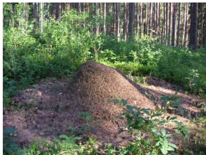
2007 wurden von den Mitgliedern des ASV Hirschberg 51 Waldameisenvölker aus Baustellen und anderen Bereichen gerettet.