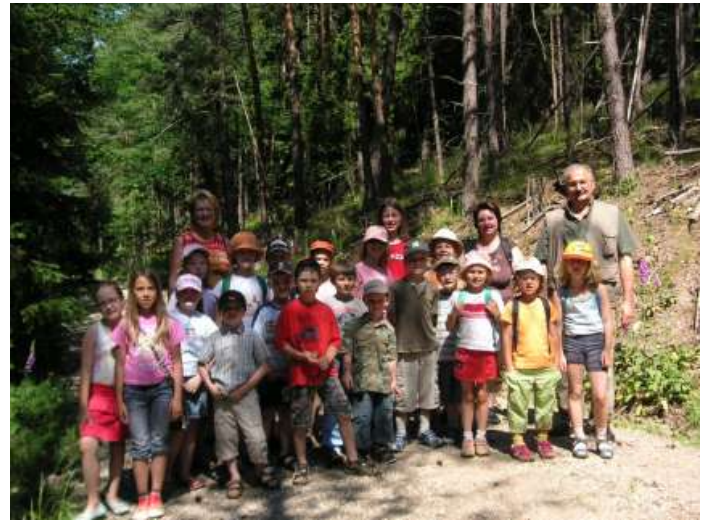
Bei zahlreichen Veranstaltungen, vor allem mit Kindern, wurde die Bedeutung der Ameisen für unsere Umwelt weitergegeben.