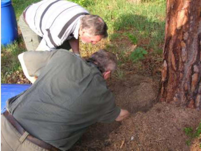
Im Jahr 2007 wurden 69 Waldameisenvölker umgesiedelt. Bild: Umsiedlung in Pleinfeld Landkreis WUG