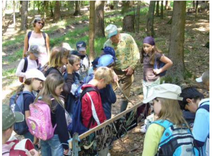
Bild: Eine Schulklasse mit Lehrerin und Forstpaten am Stand vom Ameisenschutzverein Beratzhausen. Den Kindern werden zuerst die Ameisen an Bildern erklärt, damit sie das Verhalten an den nebenliegenden Nestern besser verstehen können.

Das Hegertreffen 2007 des Ameisenschutzvereins fand am 13.10. im Steinbachtal bei Regenstauf statt. Es trafen sich zwölf Heger um 13.30 Uhr am Parkplatz der Realschule. Von dort ging es gemeinsam in das schöne Steinbachtal, um dort die noch vorhandenen Ameisennester der Formica polyctena zu erfassen und mit Fläche und Koordinaten in Excel-Tabellen einzutragen. Die Heger konnten 8 Nester auffinden.